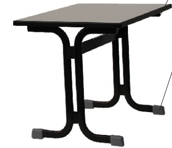
Doppel C - Form Tisch