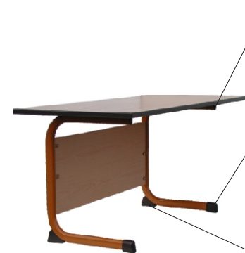
C - Form Tisch