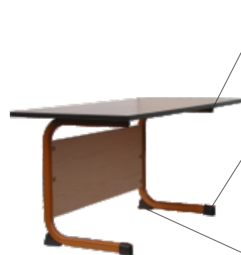
C - Form Tisch