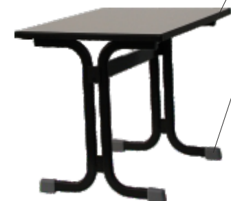
Doppel C - Form Tisch